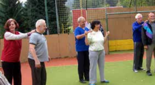
2012 Pobyt Horní Bečva