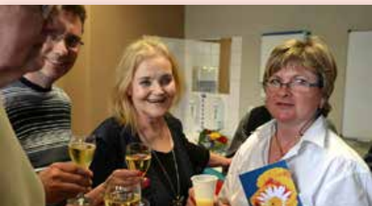
2013 Křest Knížky básniček pod patronací prof. Vališe