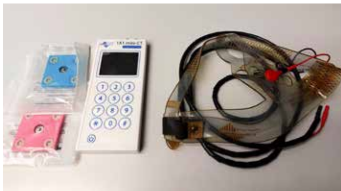
Domácí stimulator od firmy Soterix (ilustrační foto)

Vědci z výzkumného institutu CEITEC již v minulosti ukázali, že je možné řeč pacientů zlepšit pomocí rychlých magnetických pulzů (tzv. transkraniální magnetická stimulace). Nevýhodou této neinvazivní metody však je, že stimulaci nelze provádět doma a pacient musí docházet na specializované pracoviště.