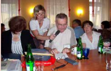
2010 Setkání Pardubice