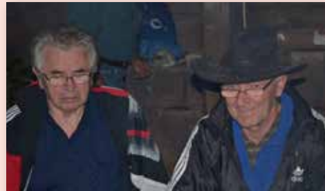
2011 Pobyt Štítkov