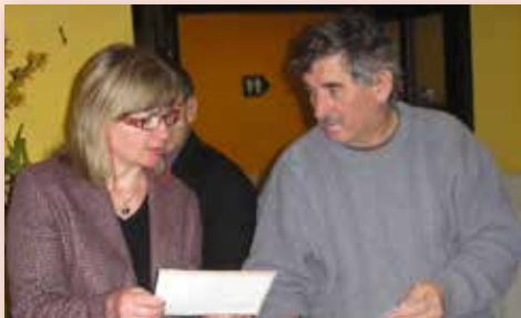
2010 Valná hromada Srbsko