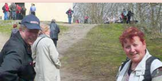
2011 Výstup na Říp