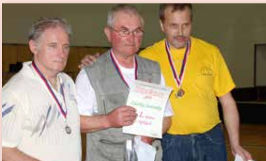
2013 Předměřické sportovní hry